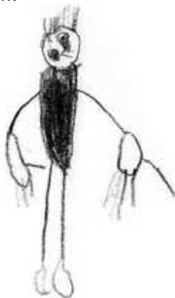
Klaas 4 jaar

Ook zijn goede ontwikkelde tekenontwikkeling was achteruit gegaan: