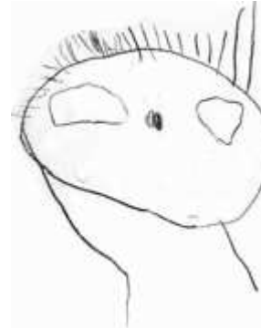
Klaas 4 jaar en 2 maanden